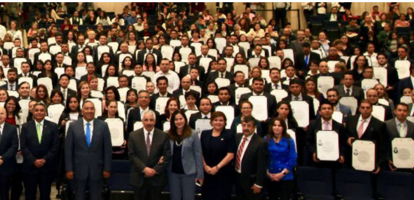
Autoridades y egresados de la UnADM generación 2018-1

Rodolfo Tuirán aseguró que la Universidad Abierta y a Distancia de México (UnADM) promueve la democratización de la educación superior en el país. El funcionario expuso que esa modalidad de estudio es capaz de facilitar el acceso al conocimiento especializado por encima de cualquier limitación de índole personal, laboral, económica o social.